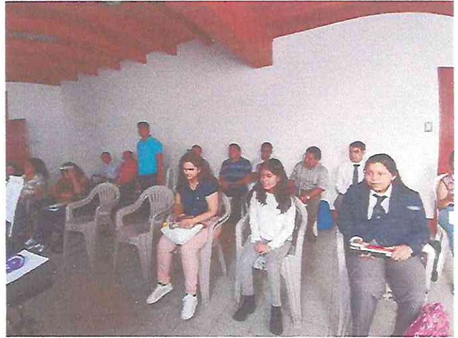
Presentación Gran Sala Efraín Recinos. Concierto Voces de Película 22/06/2023